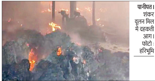
पानीपत। शंकर वूलन मिल में दहकती आग।

पानीपत के शक्ति नगर स्थित शंकर वूलन मिल में बुधवार की सुबह करीब छह बजे आग लग गई। आग ने पूरी फैक्ट्री को अपनी चपेट में ले लिया। घटना की सूचना पर एक के बाद एक दमकल के चार टैंडरों को घटनास्थल पर भेजा गया। लेकिन घटनास्थल की ओर जाने वाली गलियां संकरी होने के चलते दमकल की गाड़ियां घटनास्थल तक नहीं पहुंच सकी। दमकल टीम ने फैक्ट्री परिसर से लगते घरों को खाली करवाया। एक के बाद एक 12 टैंडरों को मौके पर बुलाया गया और इस क्षेत्र की बिजली की आपूर्ति बंद कर दी गई।