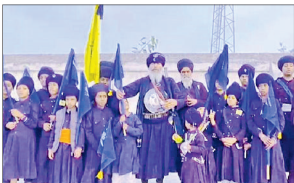
अंबाला। प्रकाश पर्व के दौरान गुरु ग्रंथ साहिब विद्या केंद्र सेवा समिति के बच्चे।