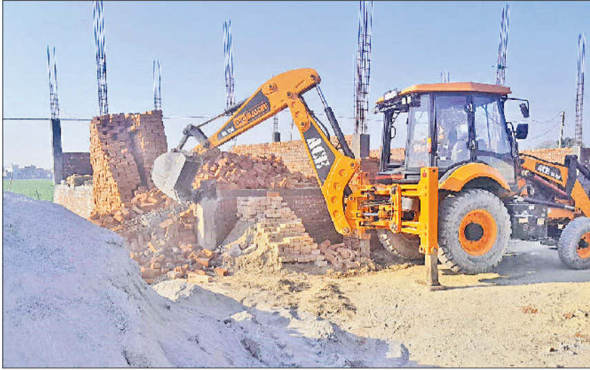
करनाल। अवैध कॉलोनीयों पर तोड़फोड़ की कार्रवाई करता पीला पंजा।