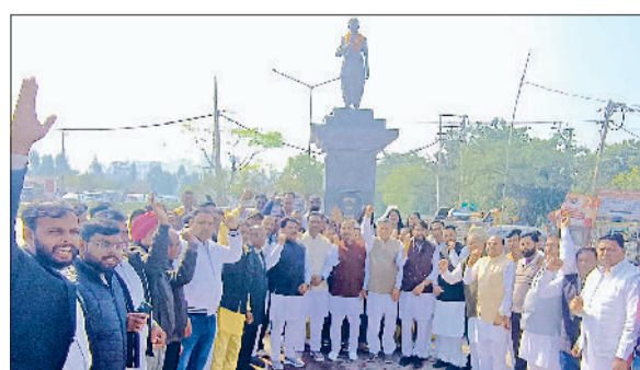
अंबाला। पंडित दीनदयाल उपाध्याय को श्रद्धांजलि देते पूर्व मंत्री व कार्यकर्ता।