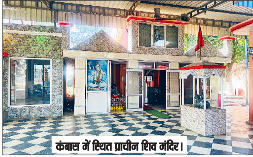
कंभास में स्थित प्राचीन शिव मंदिर।