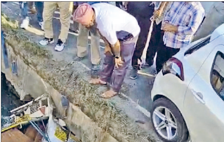
पिहोवा। पिहोवा रोड पर भाखड़ा नहर में गिरी प्लाई से लदी पिकअप गाड़ी।